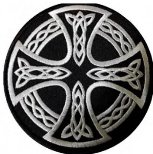
Рисунок 2. Кельтский крест. Символ многих расистских организаций