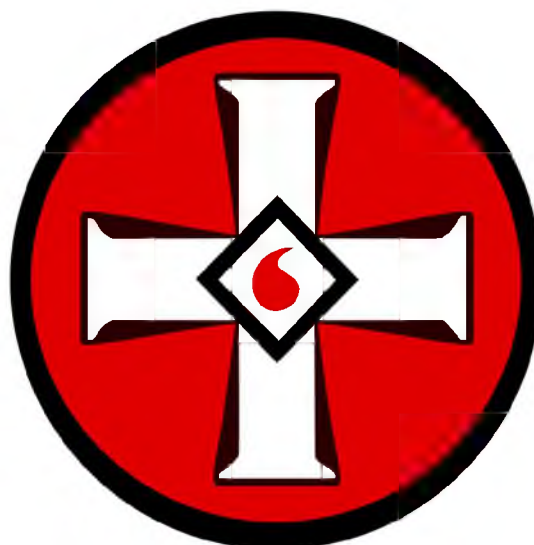
Рисунок 1. Эмблема ультраправой организации «Ку-клукс-клан»